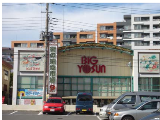
【横浜線沿線（八王子～東神奈川） 乗降客数・生活利便施設数】

表を見ていただくと各施設の乗車人員比の右側に丸数字がごございます。これが横浜線沿線20駅中のランキングになります（乗車人員数を施設数で割った数字が少ない方を上位に表示しております）。スーパーマーケットでは20駅中6位、内科が3位、歯科が4位、コンビニエンスストアは10位となり、全般的に上位のものが多くな